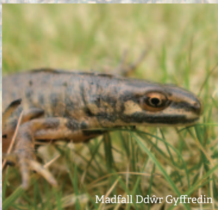
Madfall Ddŵr Gyffredin

Llygad Llo Mawr Cennin Pennawd-Rownd Cribau'r Pannwr Gwyllt Melyn Yr Hwyr