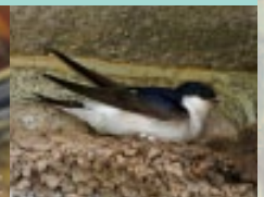
Gwennol y Bondo