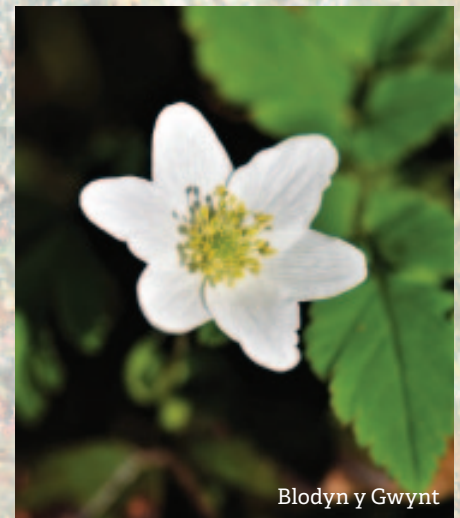
Blodyn y Gwynt