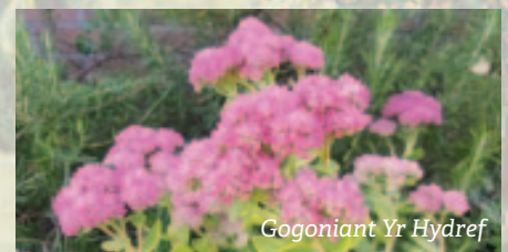
Gogoniant Yr Hydref

Eiddew Neu Iorwg Verbena Rigida Gogoniant Yr Hydref